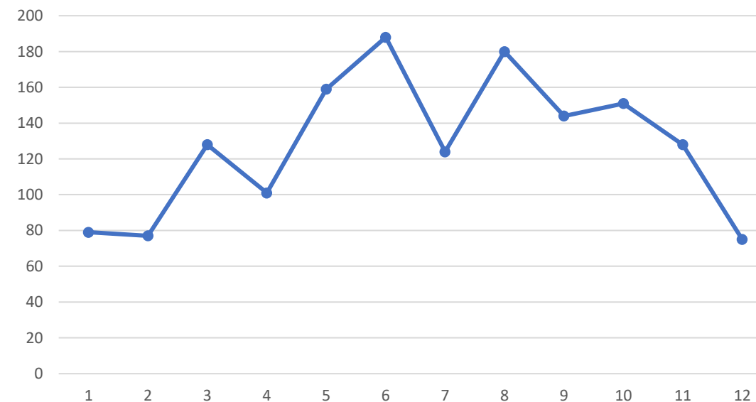
PQRD POR MES